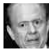
GASTÓN BENZA PFLÜCKER PRESIDENTE DE SIERRA EXPORTADORA

“La discusión de base, en el largo plazo, está entre lo que nosotros podemos ofrecer al mundo con nuestras capacidades y lo que dejaremos que ingrese al país”