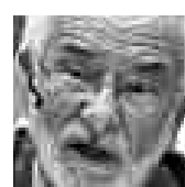
ANTONIO BRACK EGG MINISTRO DEL AMBIENTE

BUEN USO DE BIOTECNOLOGÍA. En la reunión se habló sobre los beneficios de aplicar avances científicos que no afecten la agricultura tradicional.