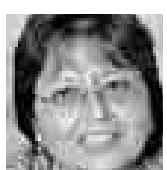
FABIOLA MORALES CONGRESISTA DE LA REPÚBLICA

“Debemos luchar para que las personas sepan y se les explique qué es lo que se hace con el producto. Y luego, pues, que vean si deciden consumirlo o no”