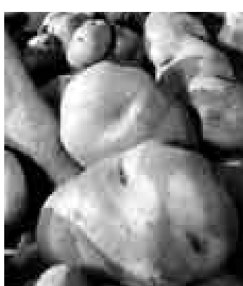
PAPA NATIVA. Los transgénicos podrían afectar esta riqueza orgánica.

No es absolutamente opuesta. Todos coincidimos en que los transgénicos no están prohibi-